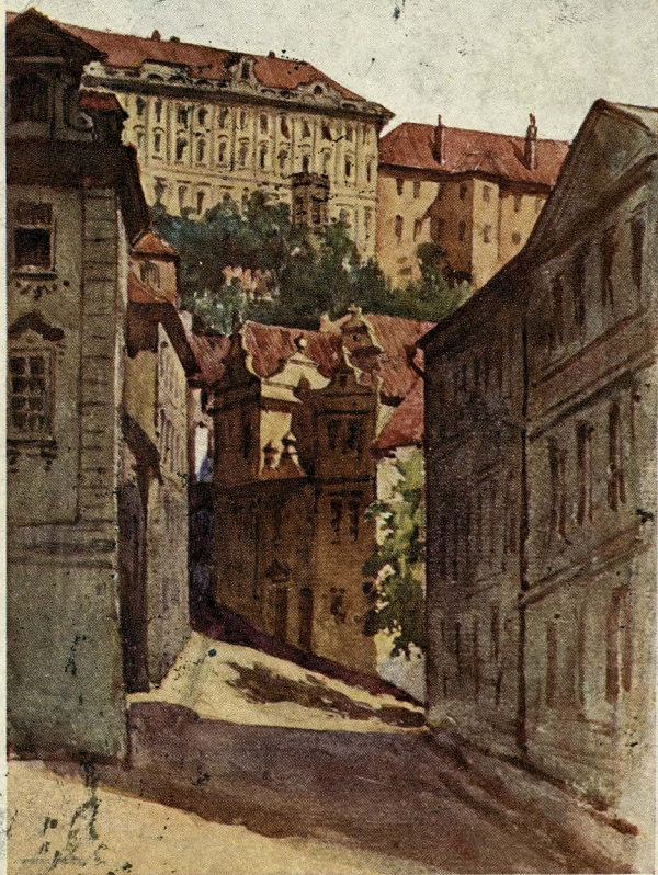
PRAHA. Pětikostelské náměstí.

Takto lepo sem Te prosila, - kaj mi res ne boš nič postal? - Škvala za kujigo. Strasma, katero ne Turje!